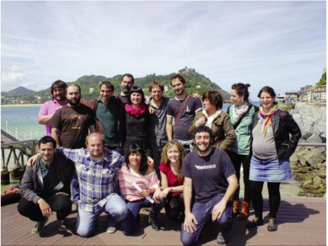
OlatuKoopen aurkezpen prentsaurrekoaren ostean, Donostian.