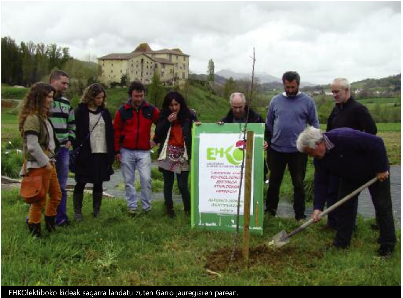
EHKOlektiboko kideak sagarra landatu zuten Garro jauregiaren parean.